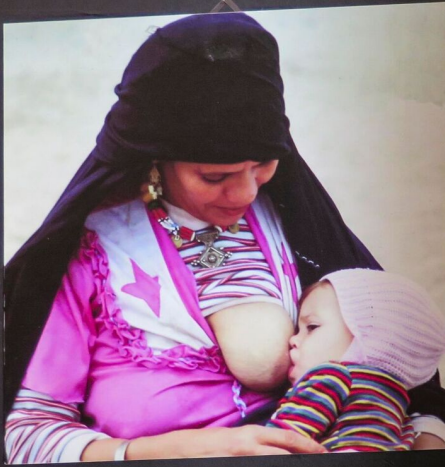
Nord Africa

Mercoledì 24 Maggio 2017 17:07 - Ultimo aggiornamento Mercoledì 31 Maggio 2017 08:10